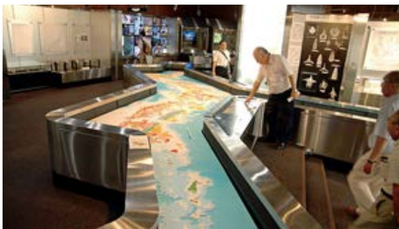
〈第1展示室：地球の歴史〉日本列島大型地質模型。34万分の1。興味のある地域の地質を調べてみましょう