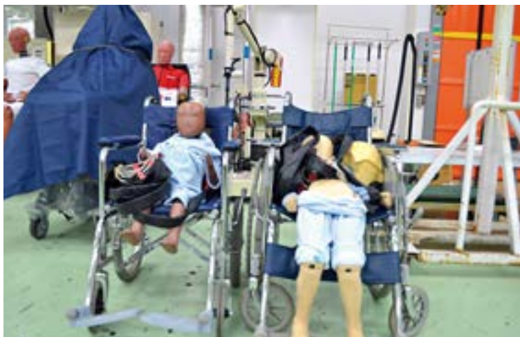
子供のダミー人形