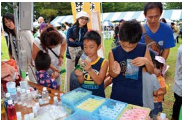
「スライムであそぼう」何色にしようかな。