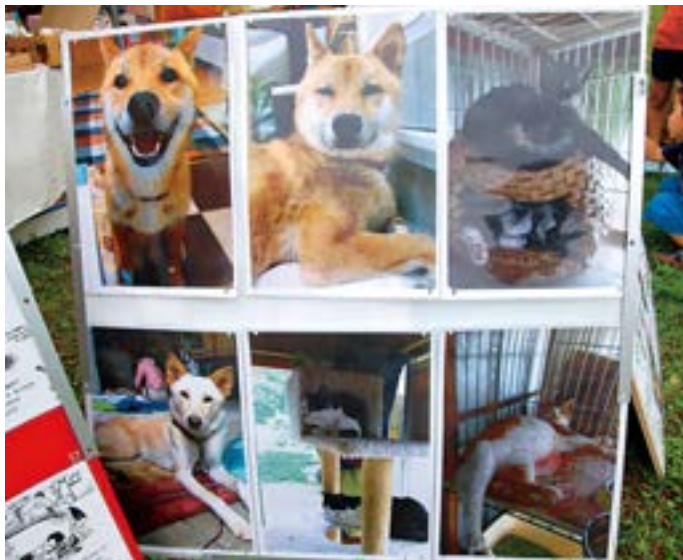
会場にはボランティアグループが設けた「ペットショップにいくまえに」コーナー。ペットは一生かわいがって育てましょう。