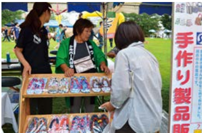
カラフルな布草履です。

わがセンター活動の根幹をなす理念のひとつが、地域社会への貢献活動です。その活動の一環として参加しているのが、例年八月下旬に開催され、県南最大の規模を誇る「わたしたちのふるさと「まつりつくば」」です。本年八月二十七日(土)～二十八日(日)に、「まつりつくば二〇一六」が、TXつくばターミナル駅に隣接するつくばセンター広場を中心とした会場で開催さ