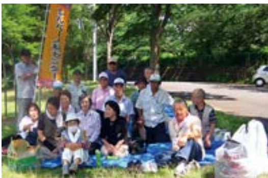
作業終了後、参加者一同カメラに、「はい、パチリ」。

見た目ではきれいなようでも1時間の作業で、空き缶・ペットボトルやたばこの吸殻など他のゴミと合わせて結構な量が集まり、これらを分別して作業が終了。そのあと皆が楽しみにしている懇談会が開催され、色々な課題、問題点に参加者から意見が述べられました。これらの貴重な意見を今後の地区の活動に活かせるようにしていきたいです。