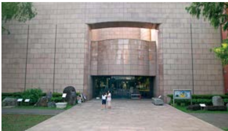
収蔵物にふさわしく重厚な外観を誇る地質標本館