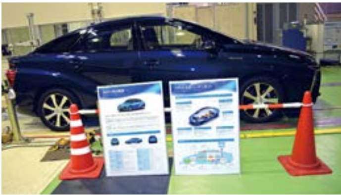
究極のエコエネルギーカー「MIRAI」(みらい)