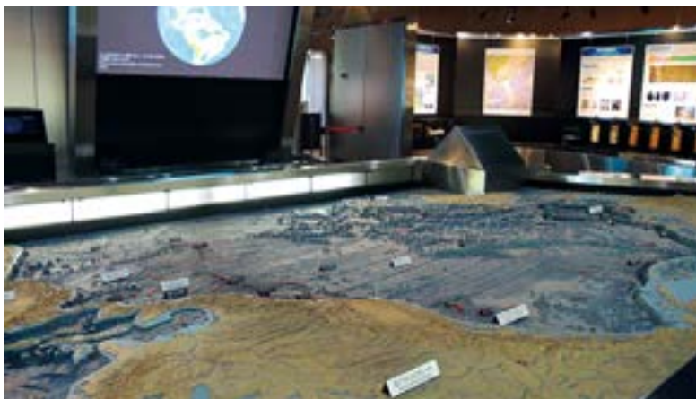
〈第2展示室：生活と鉱物資源〉600万分の1の太平洋海底地形