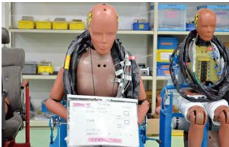
衝突実験用のダミー人形（大きさや体重は人間と全く同じようにできている）