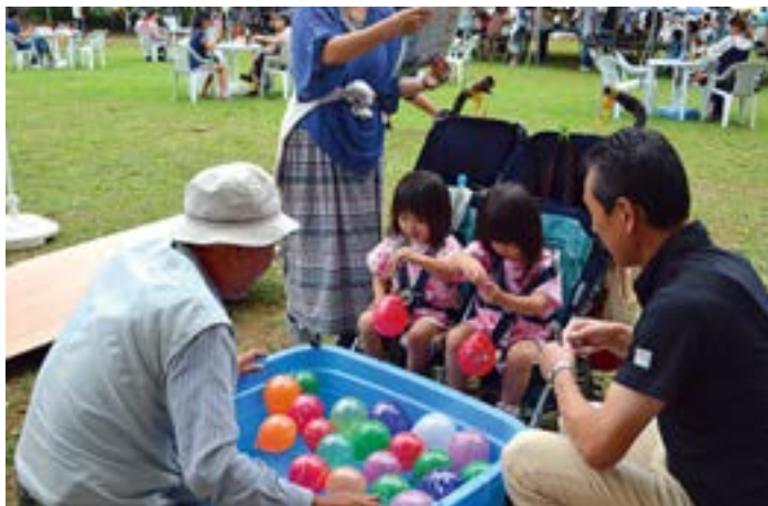
やはり同じ色ですか。