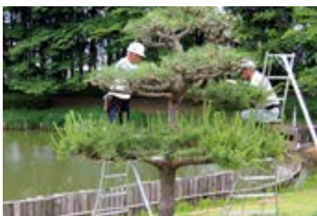
今年5月の剪定講習会、2人で仲良く松の剪定をしています。