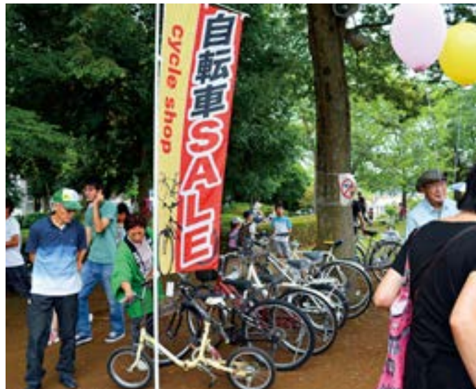
ママチャリやその他各種リサイクル自転車、販売中です。

させられるのは、やはり子どもたちの姿が多いほど、大人の方々も引き寄せられるように、自然に集まってくるということ。さて今回も小学生たちに断トツの人気を集めたのが、理科実験「スライムであそぼう」。未来の科学者のタマゴたちが夢中になる実験で、お母さんたちも子どもたちと一緒にのめりこんでおられました。子どもたちにもう一つの楽しみが、「ヨーヨー釣り」と「スーパースポールすくい」。大はしゃぎする子どもたちを見ていると、こちらまでも楽しい気持ちになってきます。