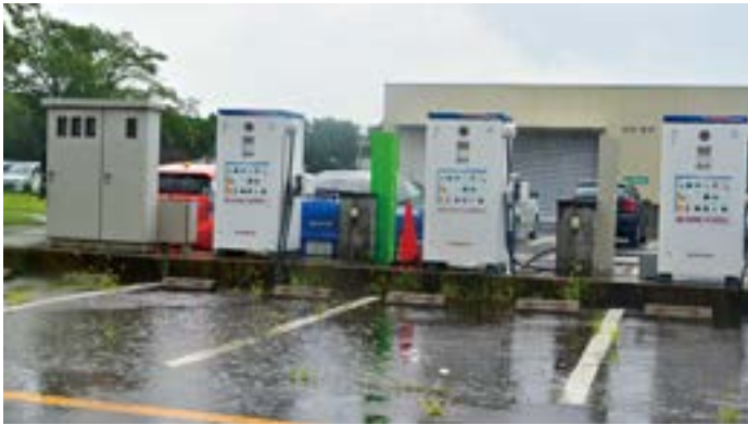
電気自動車用の電気供給ボックス