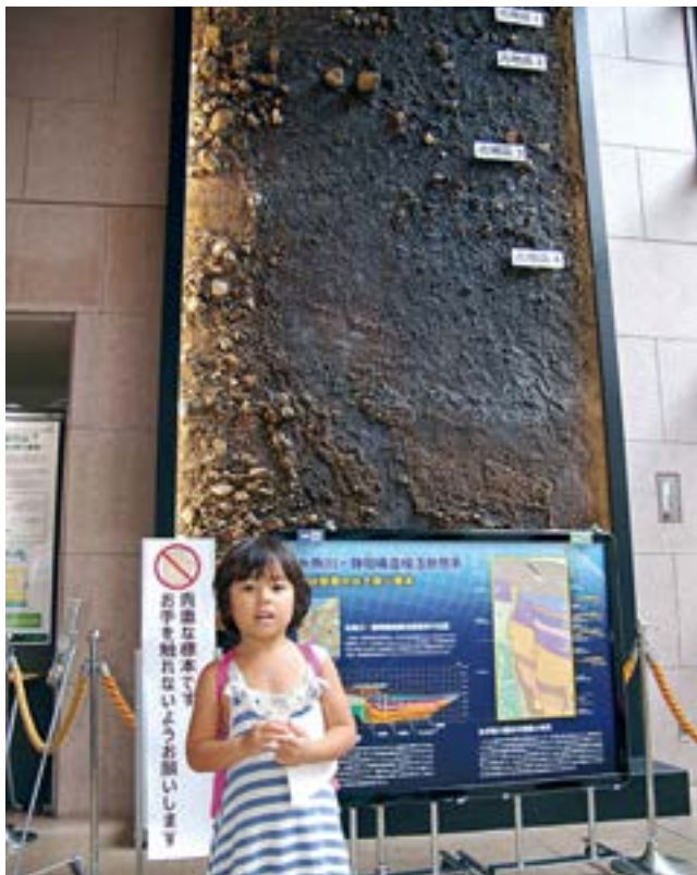
入り口正面奥にある壁面展示は、糸魚川～静岡構造線活断層系～岡谷断層のトレンチ調査の巨大な剥ぎ取り標本。これに興味津々の子どもさんだったので、お母さんのご許可をいただいてパチリ

筑波研究学園都市への研究所移転に際して、地質博物館設立の構想がおこり、一九八〇年に〈地質標本館〉がつくば市内にオープンしました。建物の正面は印象的な御影石によりデザインされ、他では見かけない堂々たる外観を誇っています。かつては資源調査の目的が強かった時もありましたが、現在では国の基盤情動的なものに重点をおくようになりました。インフラ、防災関連、衛星を活用した基礎的な情報をといること。また大学とも連携しつつ、これらの分野に必要な後継者の育成にも力を注いでいるところ