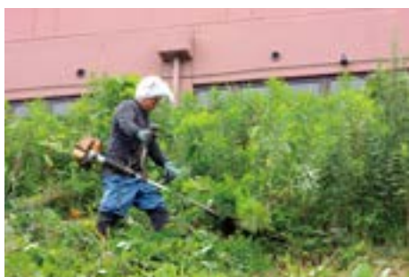
ずいぶん伸びました。草刈班の会員による作業です。

れから剪定・草刈をやってみたいと考えている一般の会員や、センターの会員ではないが上記の講習を見学したいという方にも門戸を広げていきますので、ご希望の方はセンター事務局（本誌八ページ末参照）にお問い合わせください。