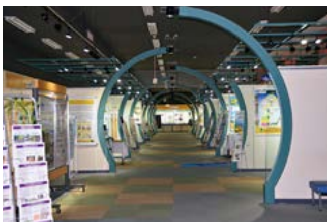
研究成果を展示するメインの展示エリア