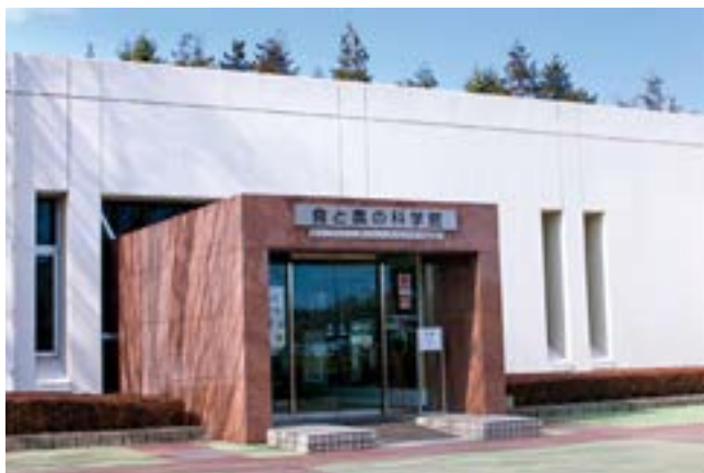
「食と農の科学館」正面