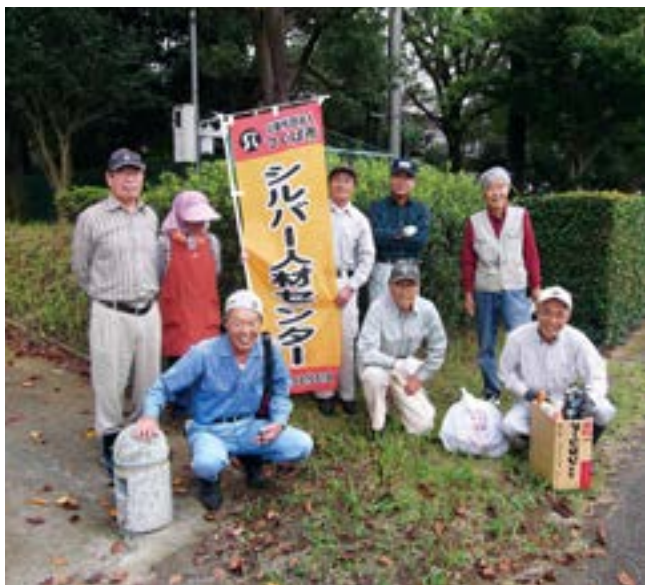
当日集まった荃崎地区のみなさん

作業が終わったところで、お待ちかねの情報交換タイムです。用意したお茶とお菓子をいただきながらのよもやま