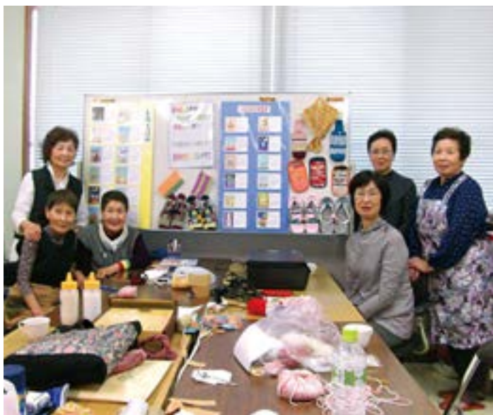
小物作り作業で集まったみなさん

この日は、朝からあいにくの雨模様でしたが、小間の前では、顔見知りの女性同士による井戸端会議の輪がたびたびできたのも、微笑ましい光景でした。