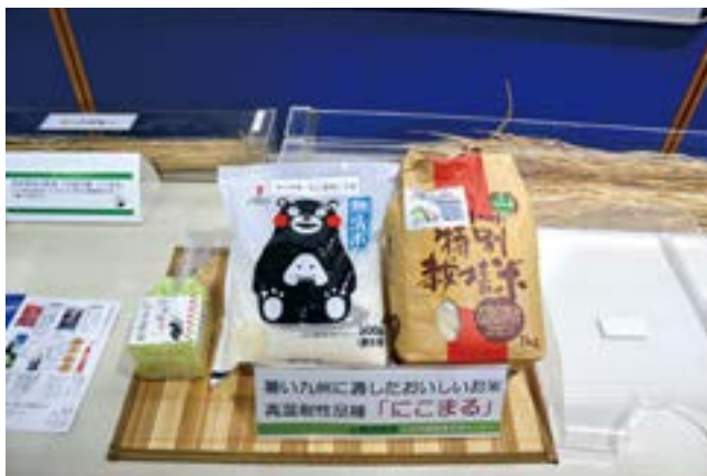
いまは地域ごとに新品種の米が開発されています