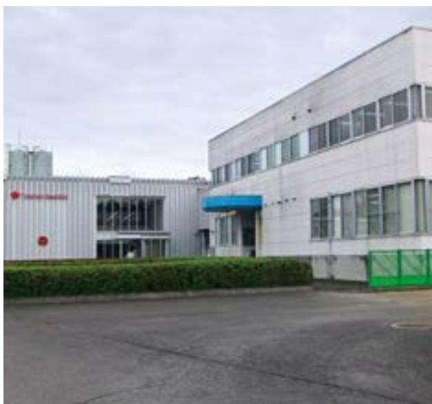
株式会社タカキベーカリーつくば工場

「おいしいモノをつくろう」を理念に、消費者の方々の食生活に一つでも貢献できるように企業を目指して、ヨーロッパの伝統技術に由来しつつ同社独自の技術による、主力のパン作り「石窯（いしがま）」にこだわり生産している専用工場は、他社も含めて、全