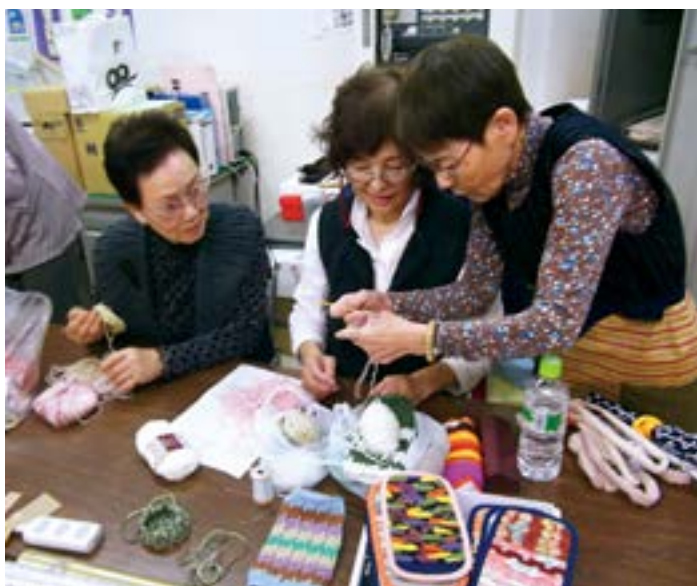
長年の経験と知恵が役にたちます

平成27年11月14日「第3回きずなぎ夢まつり」に、ポランティア活動の一環として、市内荳崎地区のシルバー女性会員が参加しました。出品したのは、みなさんが集まりを重ね、古い端切れなども利用して、何ヶ月もかけて制作した小物グッズなどの力作です。女性らしい感性とお互いをつなぐ輪（和）を実感させられました。