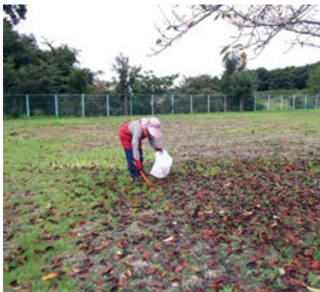
女性会員が清掃活動中

話は勿論、今どんな仕事についているとか、興味深々、話は尽きません。このお茶タイムが、楽しくまた貴重な仲間との交流となっているのです。