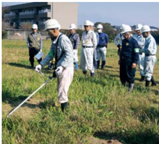
ベテラン指導員たちが見守る中で、実技中の受講者

草刈りや剪定作業は、根強い需要があり、シルバーでも人気のある仕事ですが、一面では危険性を伴う重労働と言えます。その点では、このような講習会は時宜を得たものと言えるでしょう。