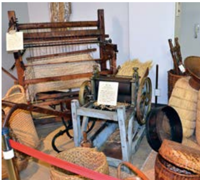
農業技術発達資料館では懐かしい農具の展示