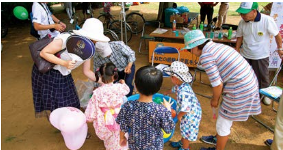
だれでも参加できるつくばまつりですが、主役はやはり子どもたちでした

TXつくば駅周辺を会場として開催され、つくば市シルバー人材センターも、全力をあげてこの大会に取り組みました。例年に比べて、今年はまつりの規模がさらに拡大され、何処もたい