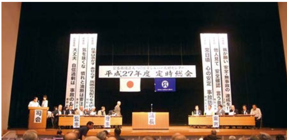
(開会直前の定時総会会場)

シルバー人材センターは、つくば市においては、昨年は子育ての活動の中で一時預かりの事業を提案していただき、現在その活動をしていただいている訳でございます。皆さん自身が様々な提案をしていただく、私どもも一緒に協力をしながら共に働く場を作っていくとか、そして子育て支援のように地元の住民が必要としている、そういうものを積極的に活動として作り出す。こういうことが今後も実現できれば、地域住民に大きくこのシル