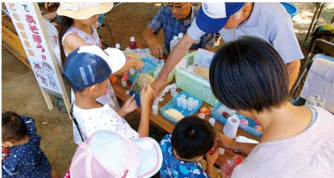
当センター初の試みとして開いた、こども理科教室コーナー「スライムであそぼう！」が超人気

へんな人混みで、大いに賑わいました。2011年3月のあの震災以降、やっとここまで盛り上がりつつ来たというのが、市民みなさんの率直な思いではなかったでしょうか。