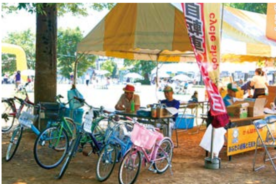
2015年8月まつりつくば2015に出店