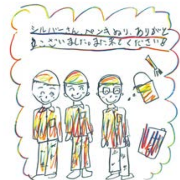
直井さん、青木さん、渡辺さんかも