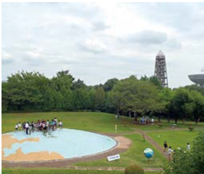
屋外には、地球広場（左）、測量用航空機「くにかぜ」（右）