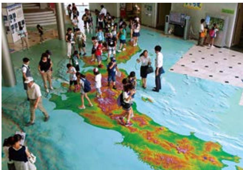
1階：子供たちに大人気の3Dで見られる立体日本列島空中散歩マップ。写真右上に、地図記号の表示板