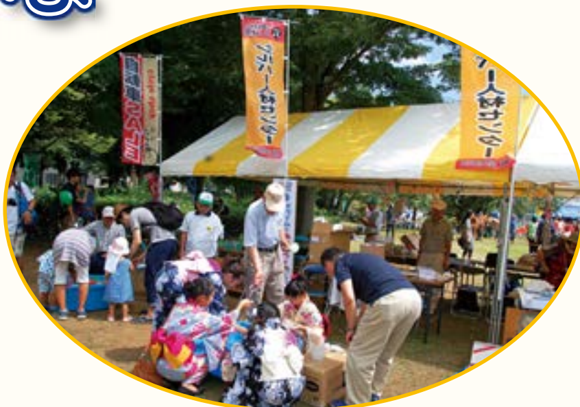
まつりつくば 2015 に参加