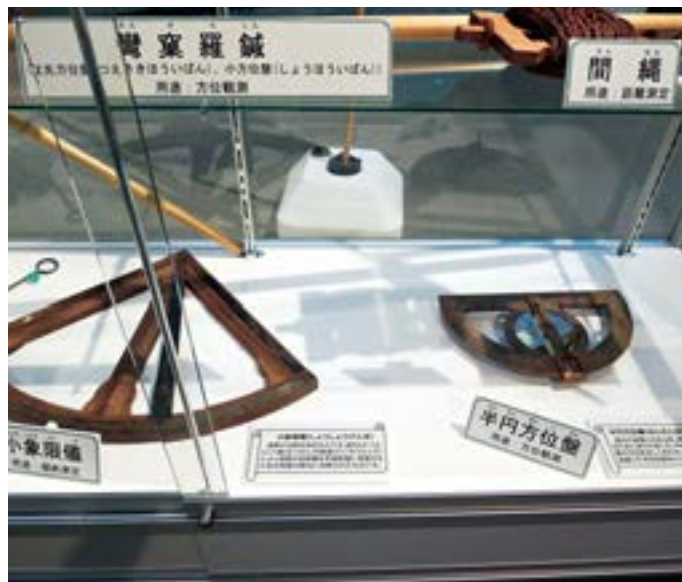
展示室：昔の測量器具