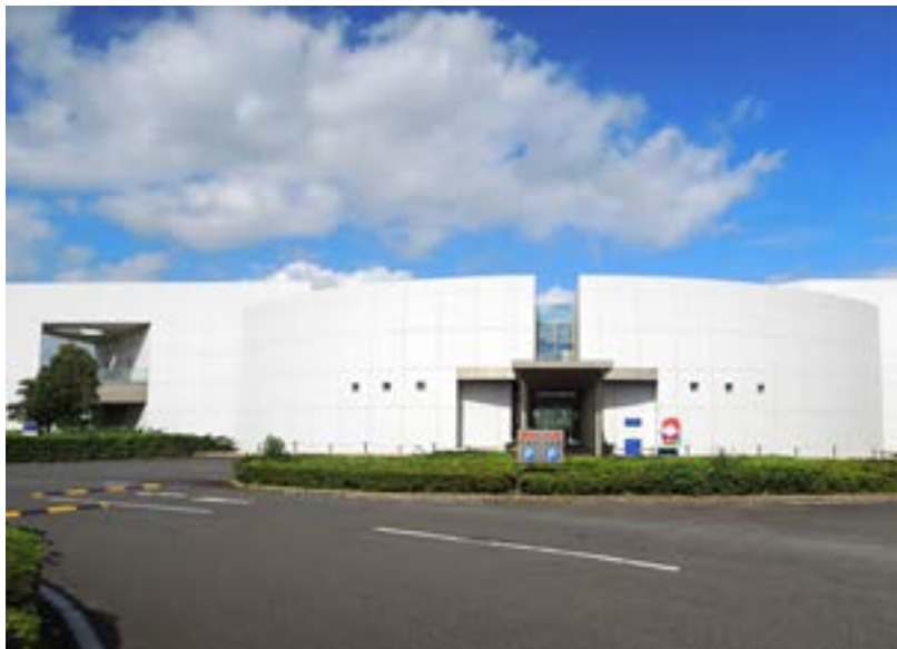
科学館の正面-入り口右手にマスコットのマップー

ました。この企画展には、子供たちだけでなく大人たちにも分かるように工夫された企画が多いと感じました。9月上旬現在実施中のプログラムをあげてみましょう。