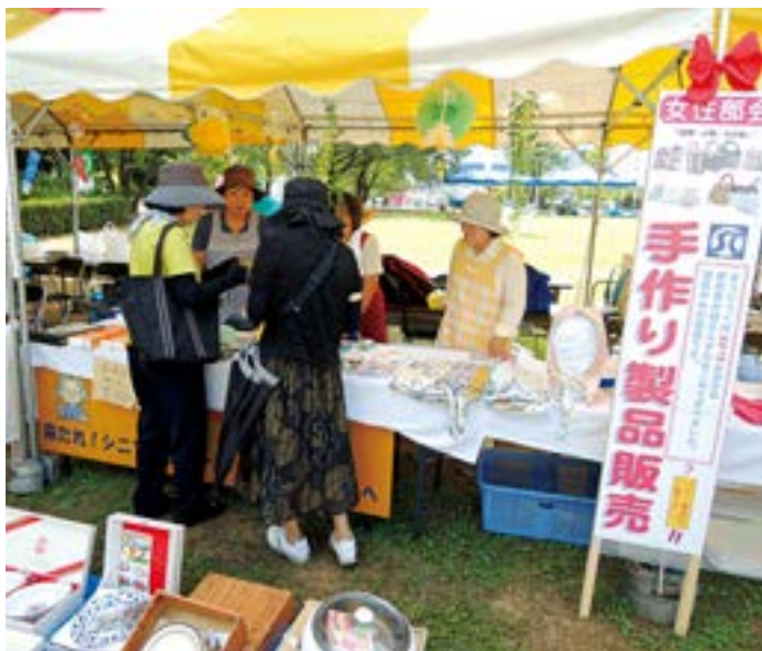
女性部会の手作りグッズコーナー