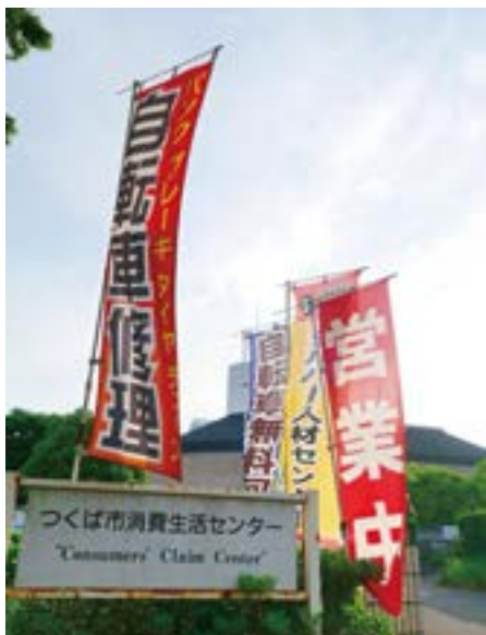
サービスステーションはシルバーののぼりが目印