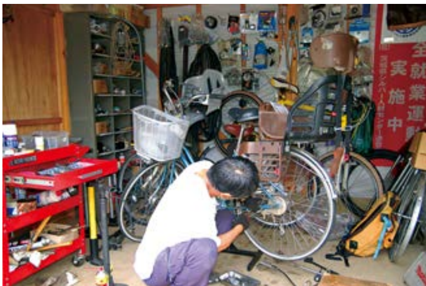
サービスステーション内で修理作業中

研修、訓練をした経験豊富な8名のメンバーで運営を行っております。中には専門的な知識・技能を持った自転車技士、自転車安全整備士の資格者もおり、修理、交換、取付、点検、調整等愛車のメンテナンスまた、リサイクル車の販売、防犯登録・TSMマーク（賠償責任補償、損害補償）、不要自転車の無料引取りを行っております。