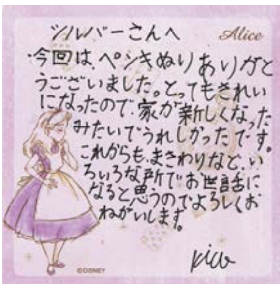
可愛い女の子からのラブレター