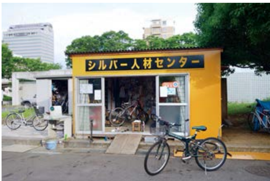
サービスステーション

研修、訓練をした経験豊富な8名のメンバーで運営を行っております。中には専門的な知識・技能を持った自転車技士、自転車安全整備士の資格者もおり、修理、交換、取付、点検、調整等愛車のメンテナンスまた、リサイクル車の販売、防犯登録・TSMマーク（賠償責任補償、損害補償）、不要自転車の無料引取りを行っております。