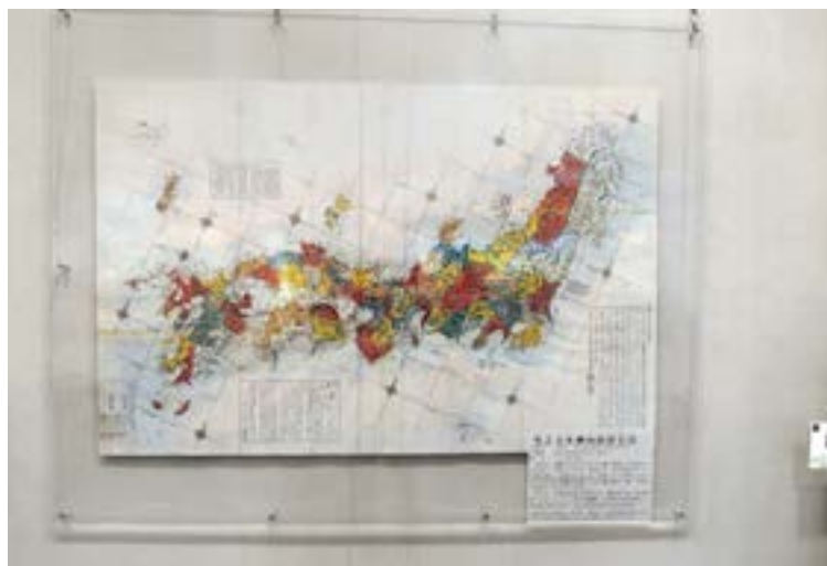
国土地理院が所蔵する貴重な古地図展示室：展示物の一つが、江戸後期に長久保赤水（ながくほせきすい）により作成された、日本最初の日本全国を複製した「改正日本輿地路程全図」（かいせいにほんよちろろいぜんず）。縮尺約130万分の一。江戸時代、一般庶民に広く普及。