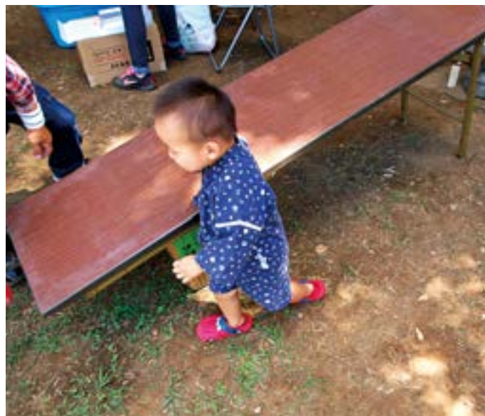
スライムボール転がしに夢中の坊や